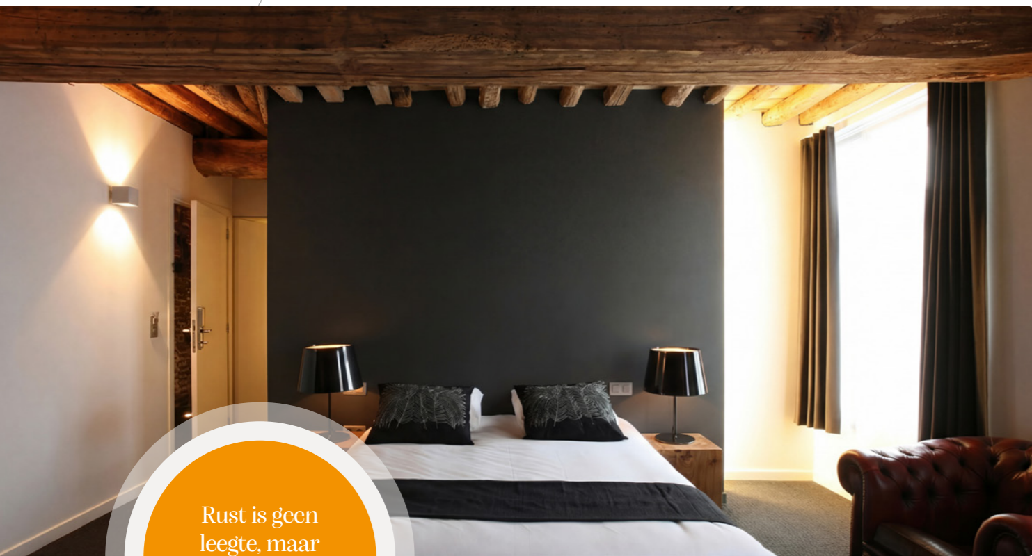
Hotel De Groene Hendrickx, Hasselt, België

Rust is geen leegte, maar bewust gekozen focus.