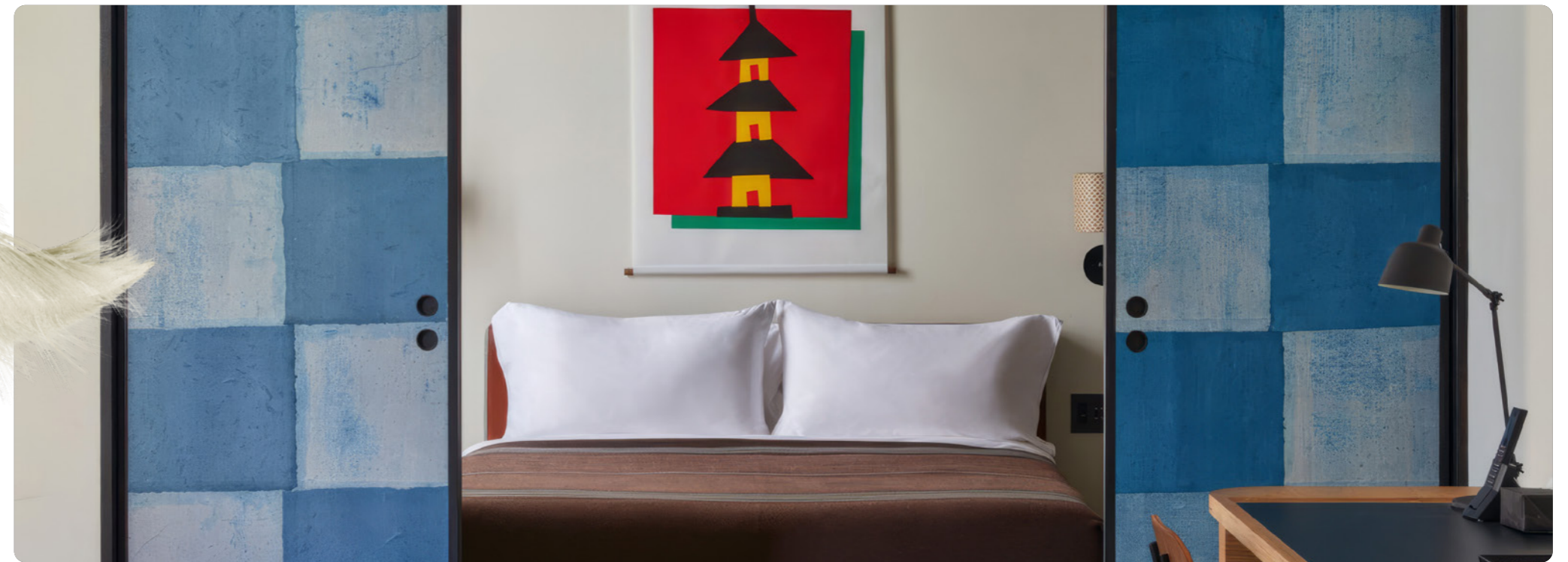
Ace Hotel Kyoto, Japan

In het Morgan & Mees in Rotterdam, een intiem boetiekhotel met amper twintig kamers, draait alles om inspirerend comfort en ontspannende charme. Alle ruimtes in het gebouw zijn uniek ingericht met moderne designelementen, terwijl het originele houtwerk, de sierlijsten, vloeren en tegels